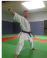
URAKEN Attaque avec le dos du poing