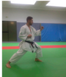
OKURI ASHI Avancer en pas croisé