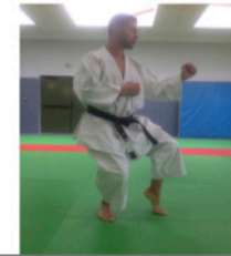
NEKO ASHI DACHI