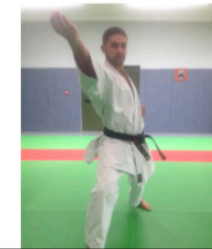
SHUTO UCHI Attaque avec le tranchant de la main