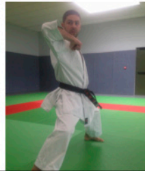
EMPI UCHI Coup de coude