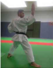
HAISHU UKE Blocage avec le dos de la main