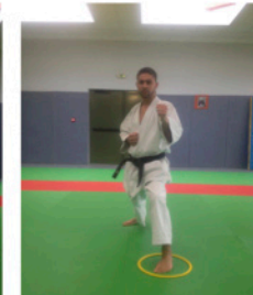
MAWARIASHI Déplacement tournant autour du pied avant